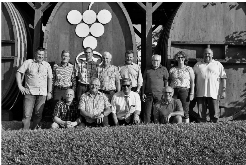
Die Delegation anlässlich der Weinverteileten in Scherzingen