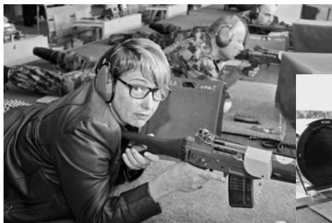
Regierungsrätin Cornelia Komposch