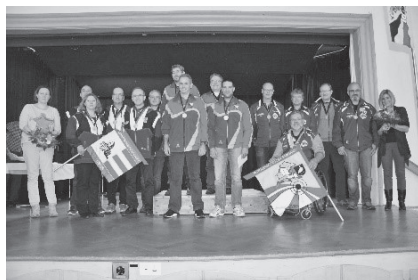
Text & Bild: Beatrice Bollhalder