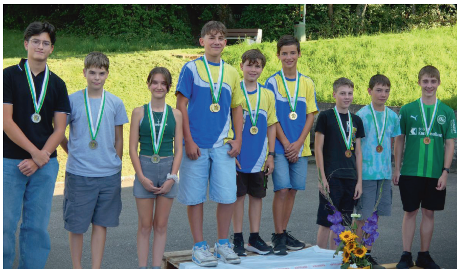
Das Podest der Kat. U15: 2. Arbon-Roggwil, 1. Bürglen, 3. Balterswil-Ifwil