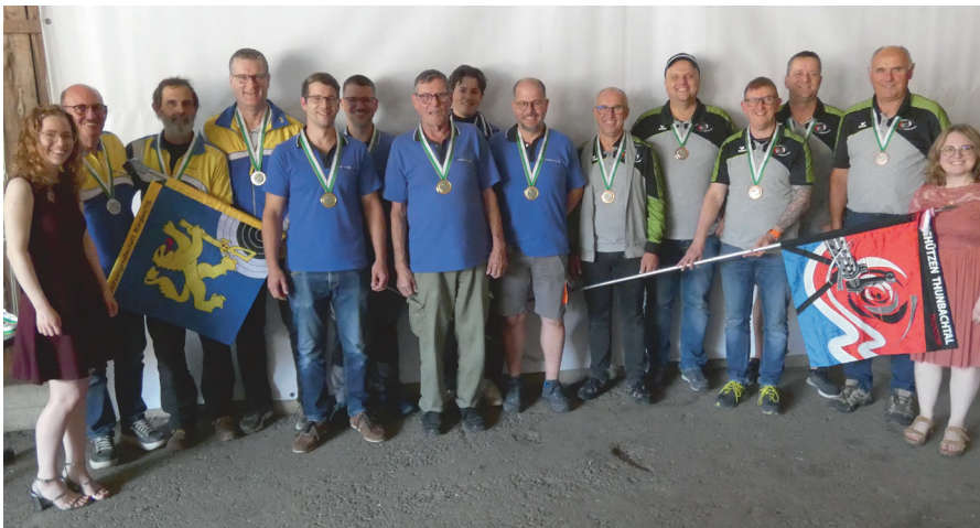
Podest Feld D