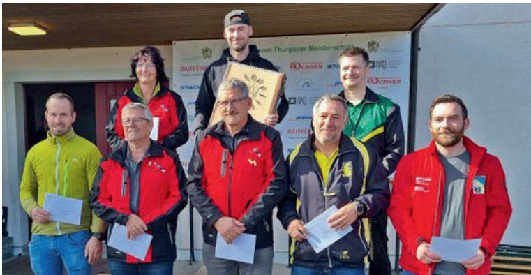
Finalteilnehmer Feld A