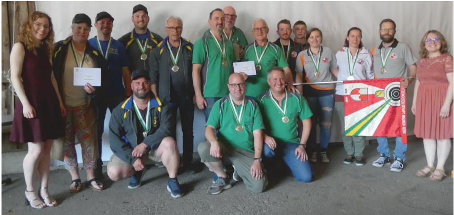
Podest Feld E