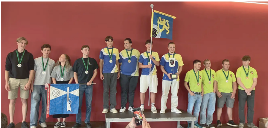
Podest Jugendliche U21: 2. Stäfa, 1. Bürglen, 3. Sennwald