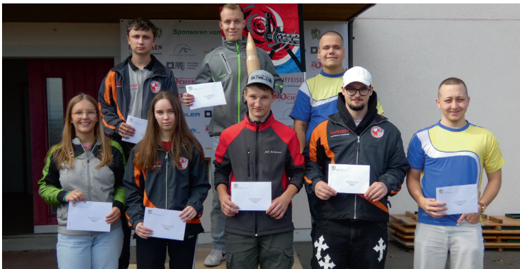
Finalteilnehmer Feld E U21