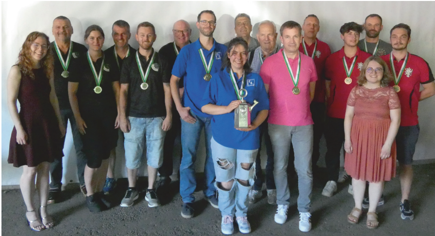
Podest Feld A