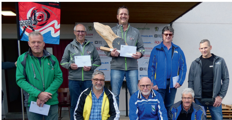
Finalteilnehmer Feld D