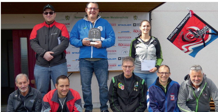
Finalteilnehmer Feld E