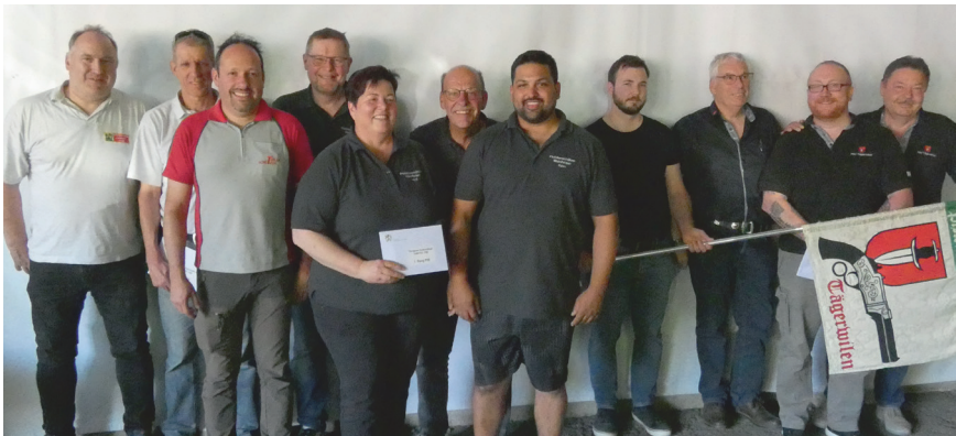
Podest P 50