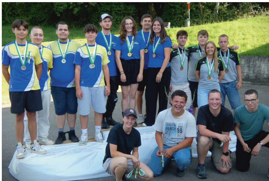
Die Gewinner der Kat. U21: 2. Bürglen 1, 1. Bussnang, 3. Thunbachtal, 4. Arbon-Roggwil