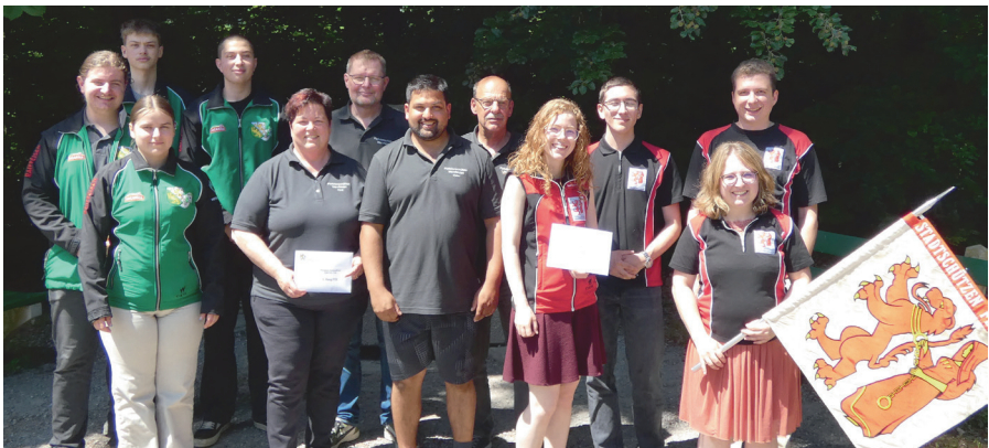
Podest P 25